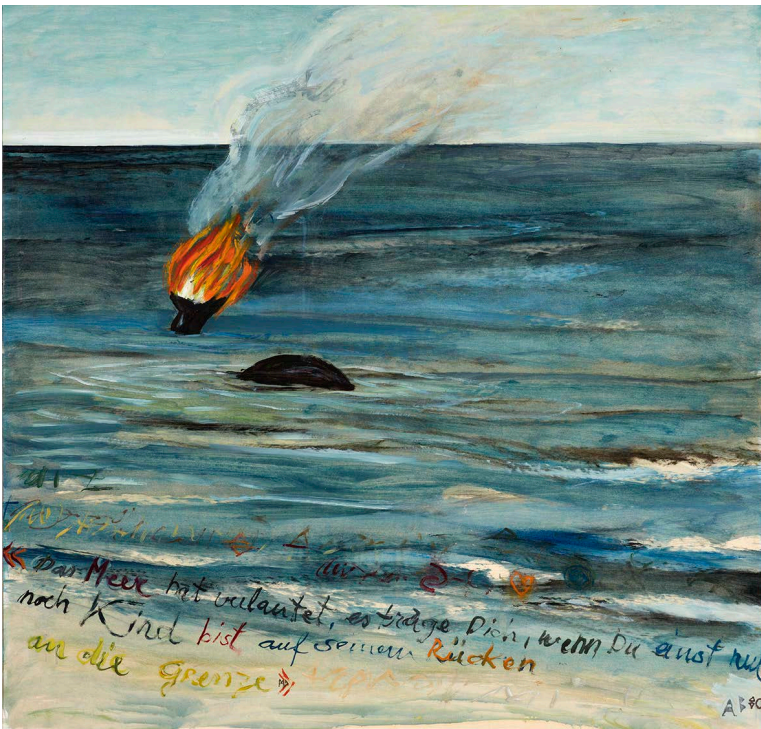
Agnes Barmettler (1945), Brennender Wal , 1980, Öl auf Papier, 93 × 90 cm, Regionales Gymnasium Laufental-Thierstein © Agnes Barmettler