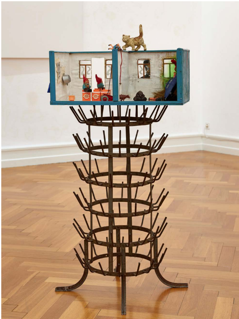
Doris Stauffer (1934–2017), Erfülltes Frauenleben , 1967, Metall, Holz, diverse Objekte in Besteckkasten, 59.8 × 27.6 × 24.3 cm