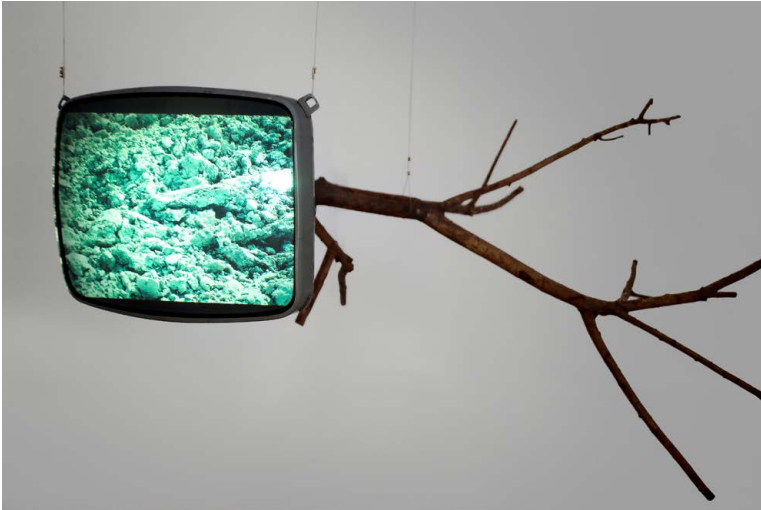
Ueli Berger, Nature Morte , 1982, TV-Röhre, Ast, Dia-Projektion, ca. 180 cm, Ausstellungsansicht Kunstmuseum Langenthal 2006, Courtesy Verein U+S Berger Design/Kunst, Foto: M. Rindlisbacher