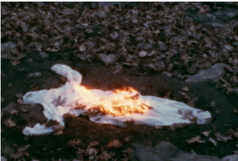
Ana Mendieta, Alma, Silueta en Fuego , 1975, Filmstill, Daros Latinamerica Collection, Switzerland