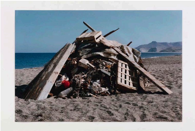
Hans Haacke, Monument to Beach Pollution , 1970/2000, C-Print, 85.1 × 127 cm, Courtesy Hans Haacke und Paula Cooper Gallery, New York © Hans Haacke/ Prolitteris