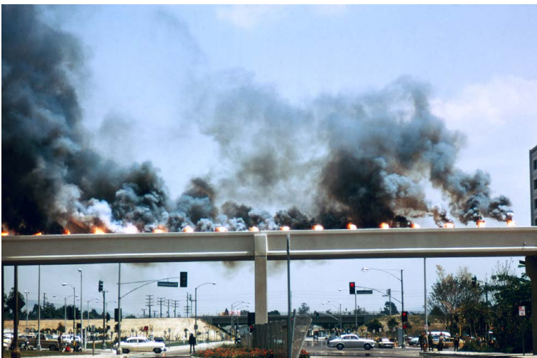
Judy Chicago (1939), Bridge Atmosphere , Fullerton, CA, 1971/2022, archivalischer Pigmentdruck auf Papier, 34 × 50.8 cm