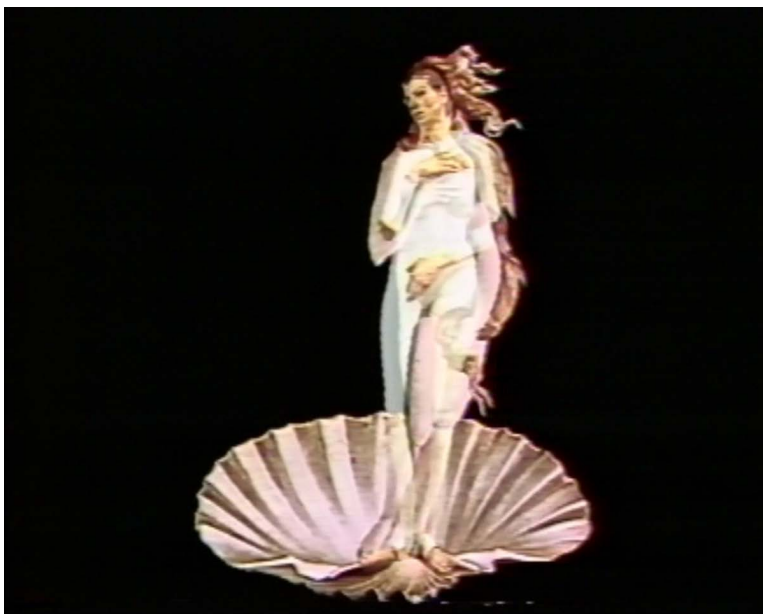
Ulrike Rosenbach, Reflexion über die Geburt der Venus , 1974/76, Videostill © Ulrike Rosenbach