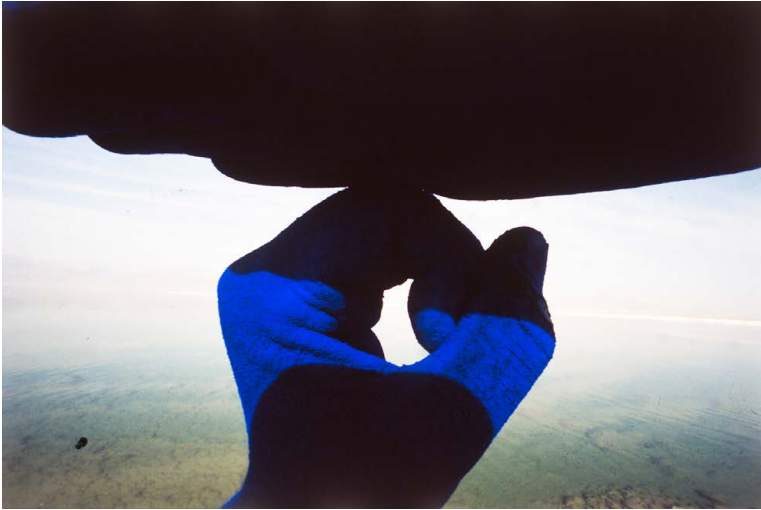
Maria Dundakova, aus dem Projekt SUN RITE , rituelle Performance und Fotografie, 1988–90 © Maria Dundakova