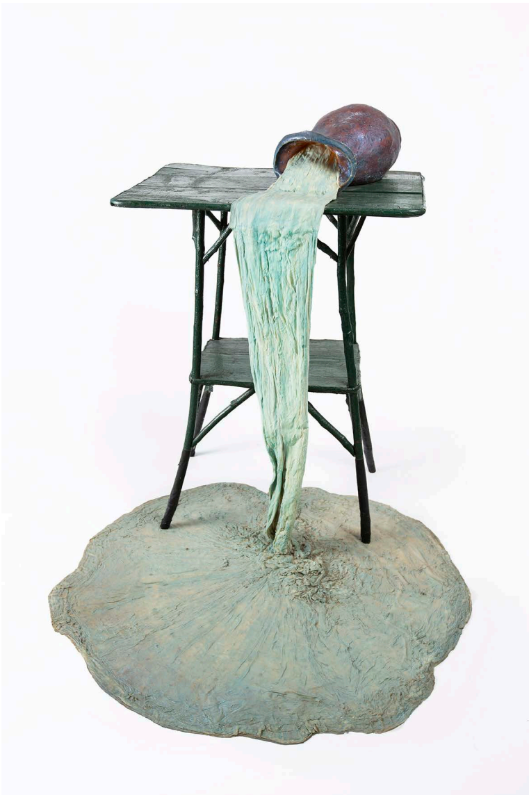
Heidi Bucher, Der Überfluss , 1986, Textil, Leim, Latex, Holztisch, Klebeband, 100 × 120 × 120 cm, Courtesy The Estate of Heidi Bucher