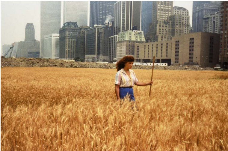
Agnes Denes (1931), Wheatfield – A Confrontation: Battery Park Landfill, Downtown Manhattan , 1982, C-Print, 40.6 × 50.8 cm, Courtesy of the artist, Leslie Tonkonow Artworks + Projects, New York and acb Gallery, Budapest

Kunstmuseum Solothurn Werkhofstrasse 30 CH-4500 Solothurn