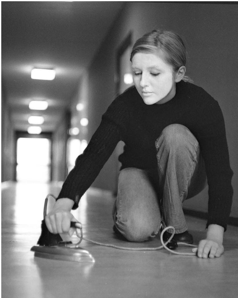
Renate Eisenegger, Hochhaus (Nr. 1) , s/w-Fotografie auf Holz kaschiert, 1 von 4 Tafeln je 24 × 30 cm, Courtesy Renate Eisenegger und Sammlung Verbund, Wien © René Eisenegger