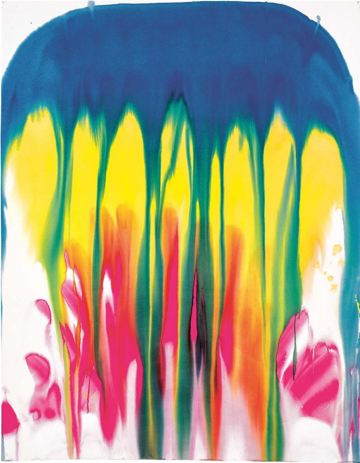
Miriam Cahn, atombombe , (7.9.1991), Wasserfarben auf Papier, 248 × 195 cm